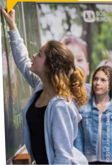
© 2016 Jonathan Studik - Spielmannsilder