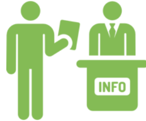
Unterrichtseinheit Berufs- und Studienorientierung Modul 3