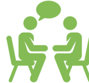
Workshop Sustainable Development Goals Modul 4