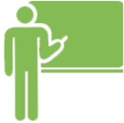
Unterrichtseinheit Familie Modul 1