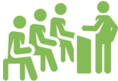
Projekte für Klassen und Kurse Modul 5