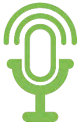
Podcasts Arbeit/Leben im SOS-Kinderdorf