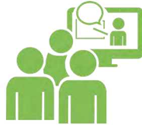
Webinar Berufs- und Studienorientierung Modul 3