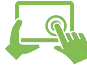
SOS-Kinderdorf App Modul 2