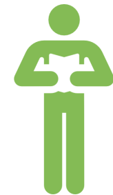
Kostenfreies Material Info- und Schulmaterial