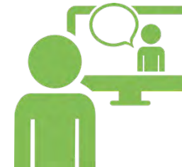
Weiterbildung für Lehrkräfte Modul 8