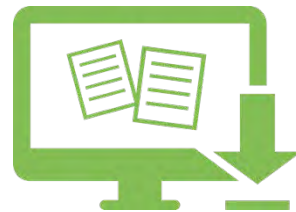
Unterrichtsmaterial via Download , Post, digitaler Lernumgebung