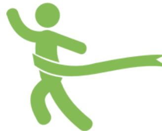
Spendenprojekte starten Modul 6