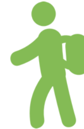
Erlebnisreiche Exkursionen Modul 7